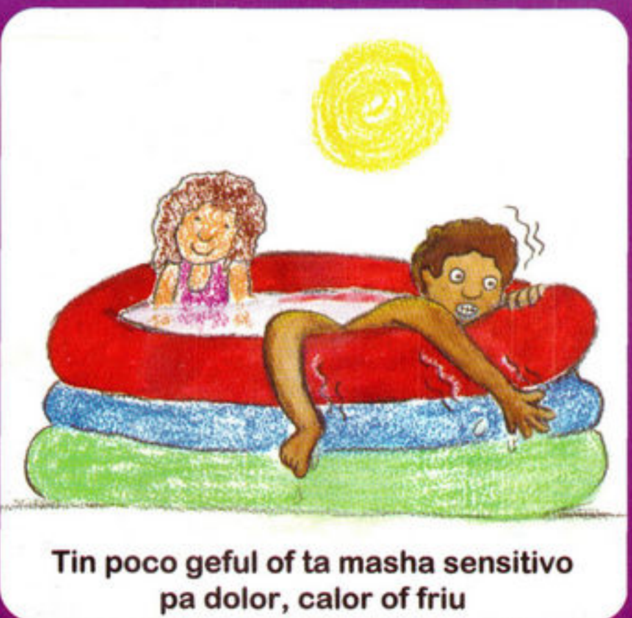
Tin poco geful of ta masha sensitivo pa dolor, calor of friu